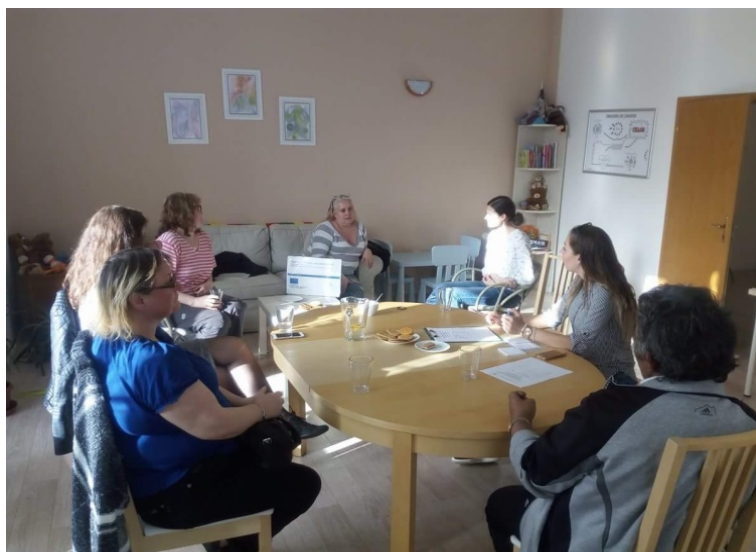
Workshop s rodiči v doučovacím klubu EUROTOPIA