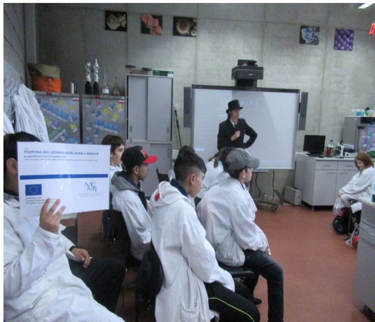
Výlet do Světa technika Ostrava