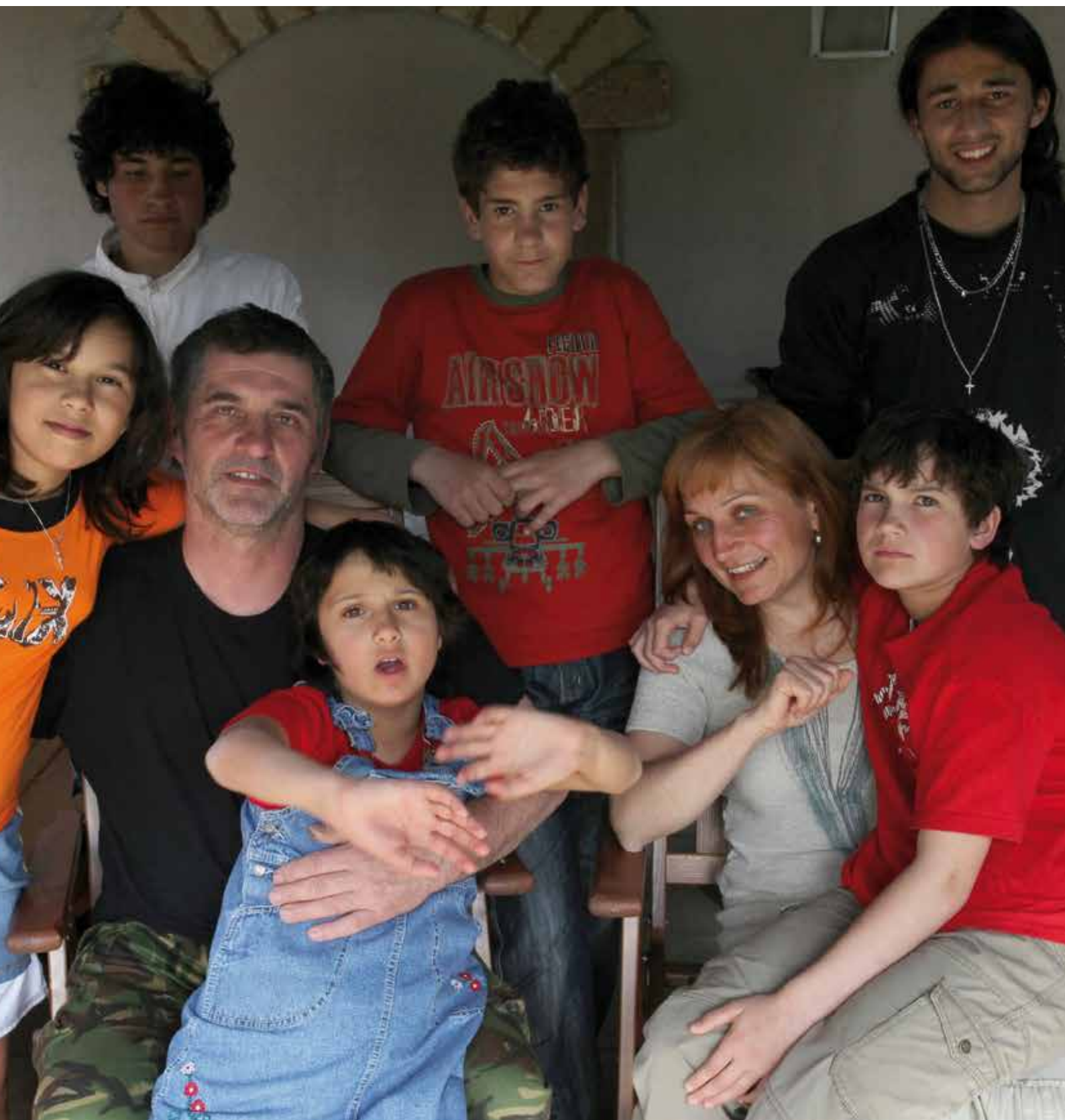
rodina Striových: 5 dětí v pěstounské péči