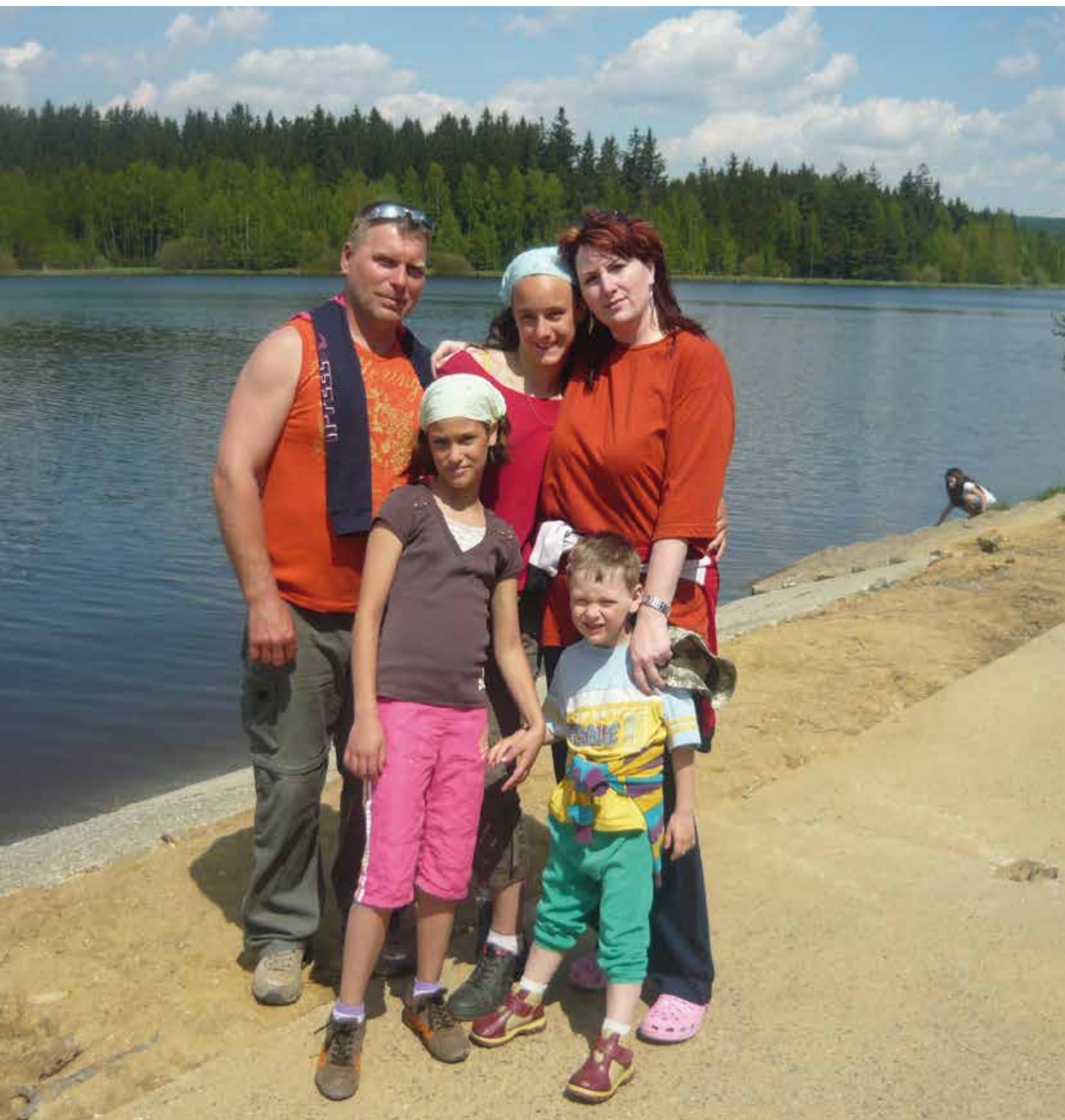
rodina Dědova: 3 děti v pěstounské péči